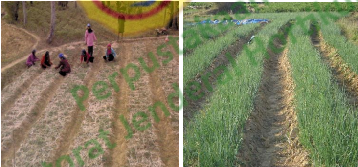
Gambar 6. Penyiangan bawang merah