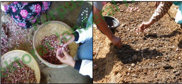
Gambar 3. Pemotongan ujung umbi dan penanaman