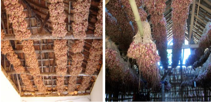
Gambar 7. Penyimpanan benih secara tradisional dengan para-para dibawah atap rumah