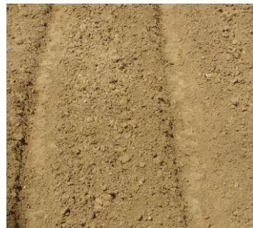
Gambar 2. Pengolahan tanah dan bentuk bedengan