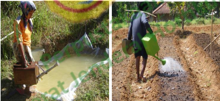
Gambar 5. Air embung untuk mengairi tanaman bawang merah dengan gembor