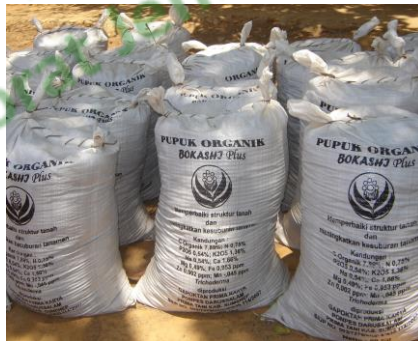
Gambar 4. Pupuk organik (Bokashi)