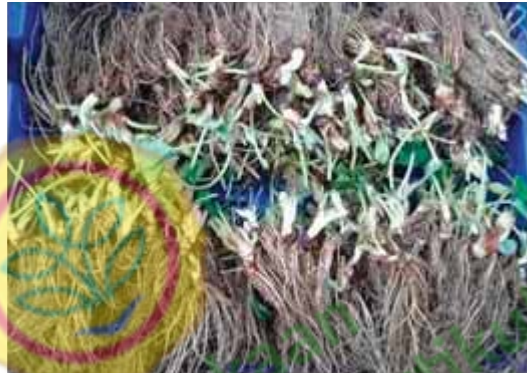
Gambar 6. Pembersihan akar dari media tanam