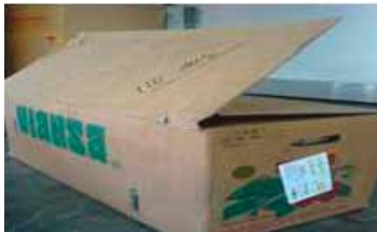
Gambar 7. Pengemasan Pengiriman Jarak Jauh.