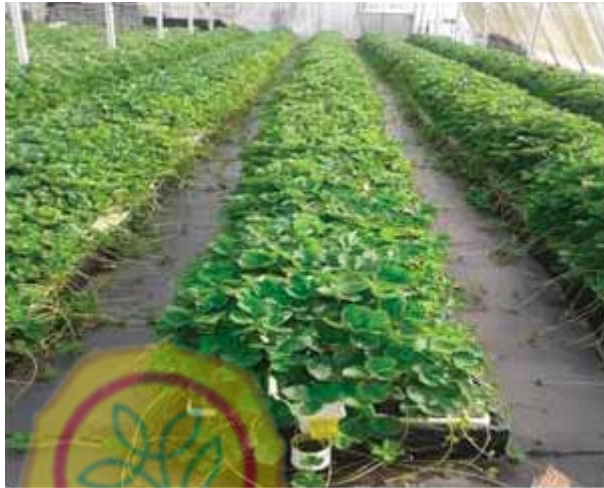
Gambar. 4. Produksi Benih Stroberi Skala Besar