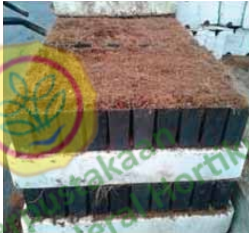
Gambar.2. Penyiapan media tanam,