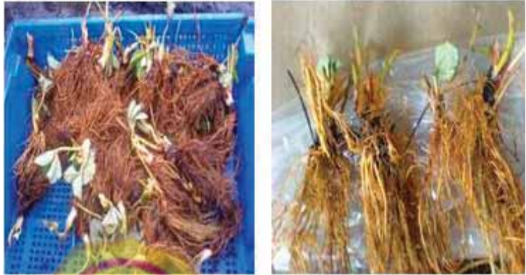
Gambar.1. Proses aklimatisasi (kurangi daun, batang/ranting yang telah menghitam dan perakaran tanaman)