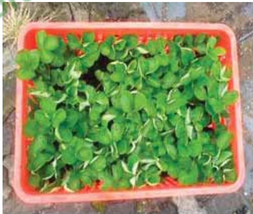
Gambar 5. Pengemasan Pengiriman Jarak Dekat