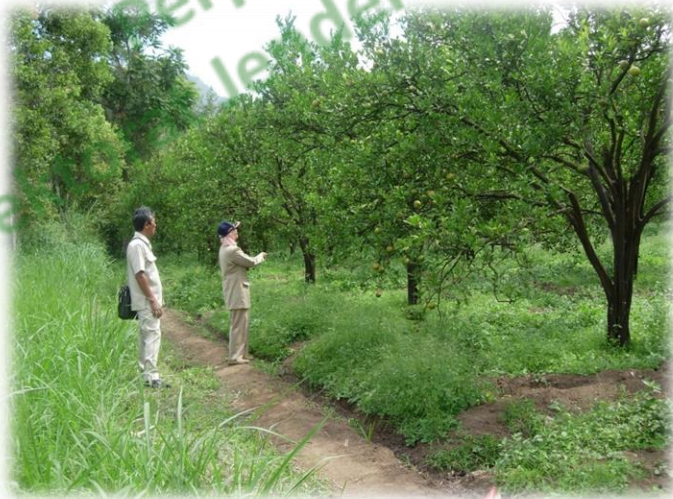
Kebun Jeruk Siam Gunung Omeh di Gunung Omeh