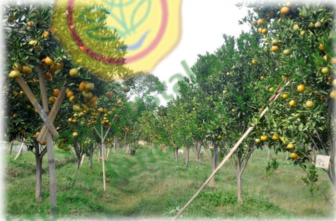
Kebun Jeruk Keprok Pulung di Tlekung