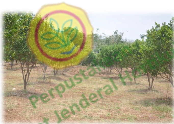
Kebun Jeruk Keprok Tejakula di Tuban