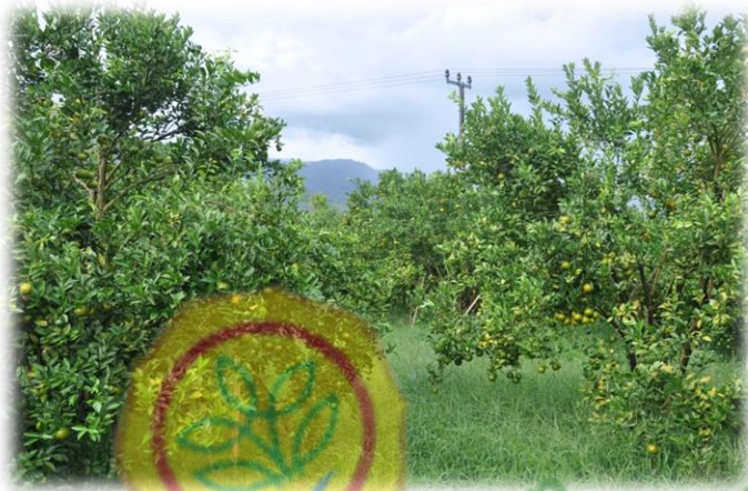
Kebun Jeruk Siam Madu di Karo Sumut

Perpustakaan Direktorat Jenderal Hortikultura