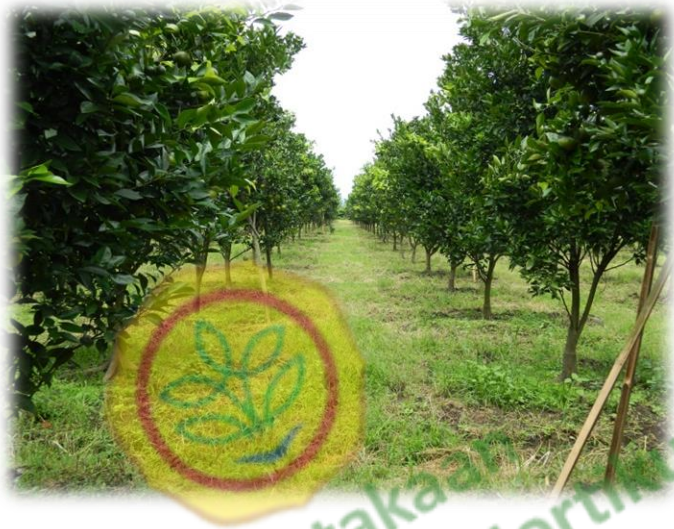
Kebun Jeruk Siam Pontianak Pulung Poncokusumo

Perpustakaan Direktorat Jenderal Hortikultura