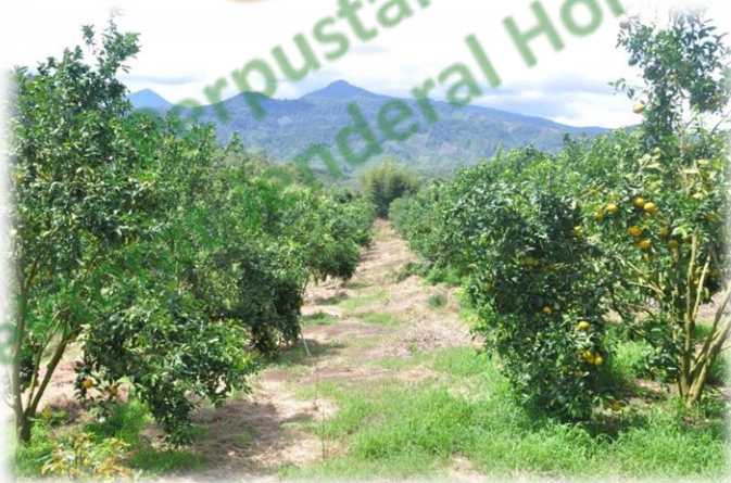
Kebun Jeruk Keprak RGL di Kec. Rimbo Pengadang