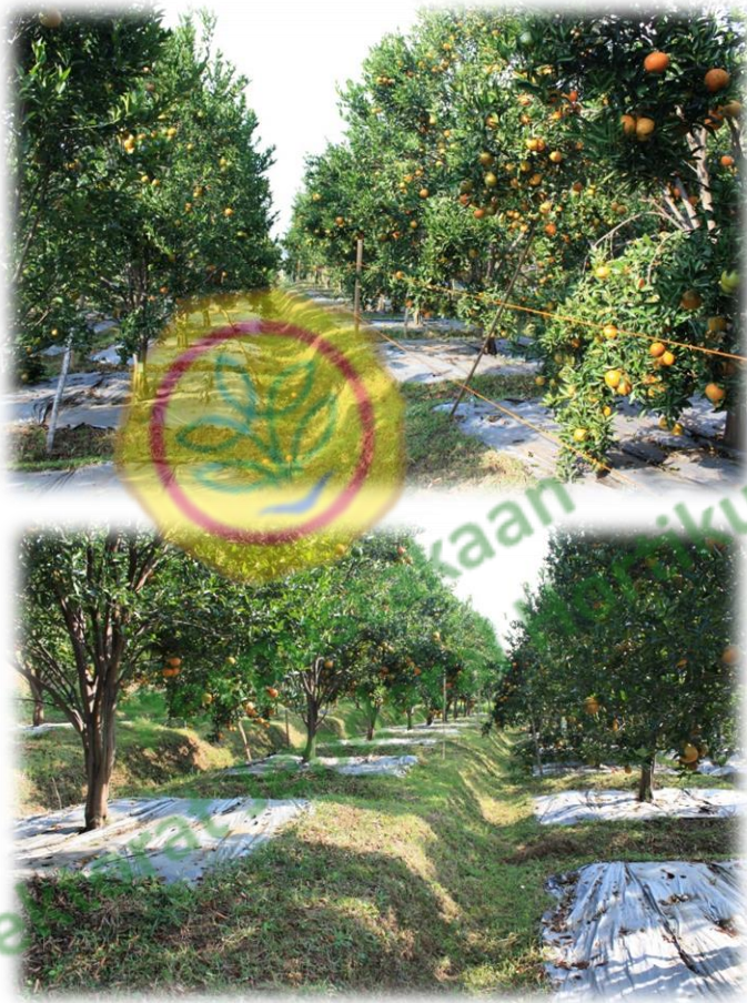
Kebun Jeruk Keprok Batu 55 di Tlekung