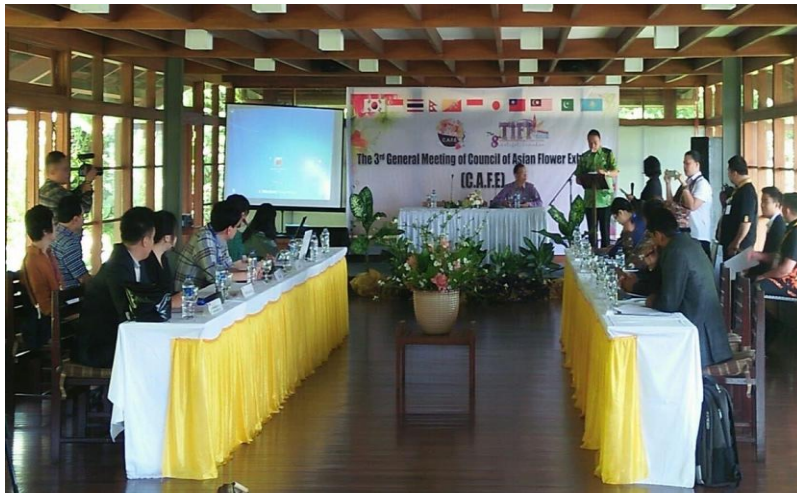
3 rd General Meeting Council Of Asian Flower Exhibition (C.A.F.E) 6 – 9 Agustus 2018 di Aula Alamanda Retreat (Bukit Doa Mahawu)