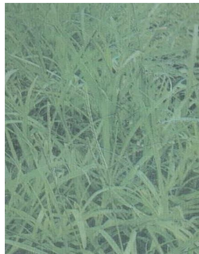
Gambar 11. Gulma Echinochloa colonum (L.); Gambar 12. Eleusine indica