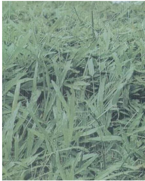
Gambar 1. Gulma Ageratum conyzoides ; Gambar 2. Gulma Axonopus sp