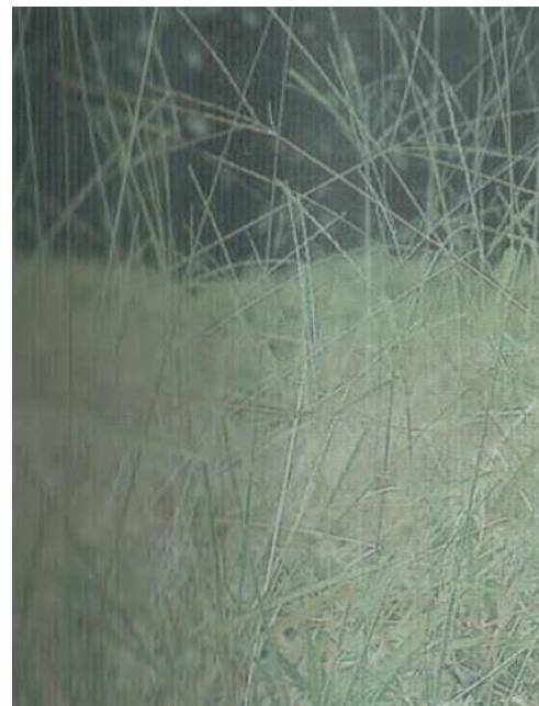
Gambar 7. Gulma Cyperus rotundus ; Gambar 8. Gulma Digitaria sp