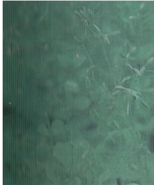
Gambar 9 dan 10. Gulma Drymaria cordata