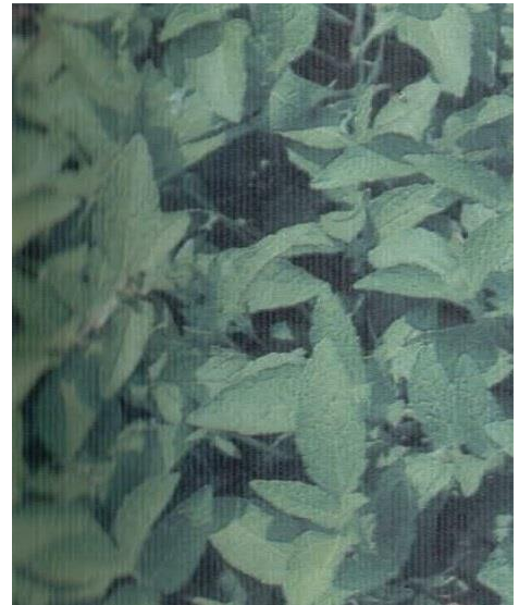
Gambar 17. Gulma Paspalum conjugatum ; Gambar 18. Gulma Synedrella nodiflora

Disusun dan diolah dari berbagai sumber oleh : Hendry Pugh Susetyo, SP, M.Si Fungsional POPT Ahli Muda Direktorat Perlindungan Hortikultura