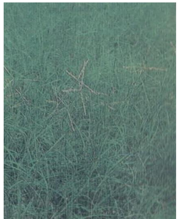
Gambar 5 dan Gambar 6. Gulma Cynodon dactylon